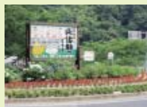
旭地区国道429号線旭川ダム湖畔花壇

地域福祉事業に偏らず事業の幅を広げ部員の方が参加しやすいよう魅力ある事業を展開していきたいと思っています。