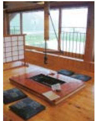
自然の中でしか味わえないアマゴ野菜をどうぞ