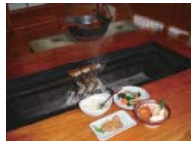
囲炉裏焼きコースメニュー すみれ1,200円