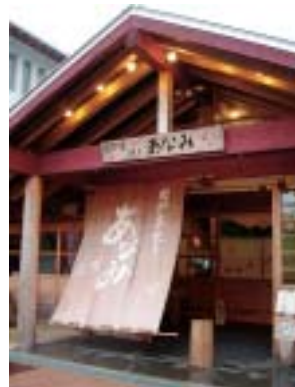
のれんに赤とんぼが付いています