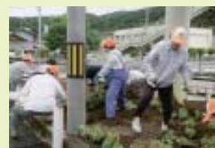
久米南地区国道53号線沿花壇花植え