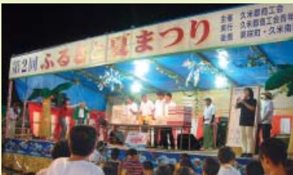
昨年のふるさと夏まつり