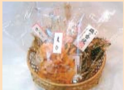
瀬戸内海の珍味 各種525円