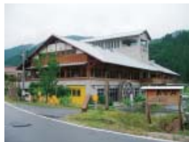
1階は加工場、2階がおみせです